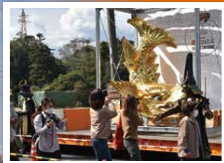
中津川市の道の駅で特別展示された 名古屋城「金のしゃちほこ」(4月6日)