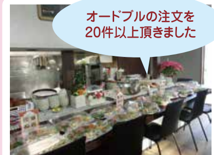
こうじキッチン こぎちゃん