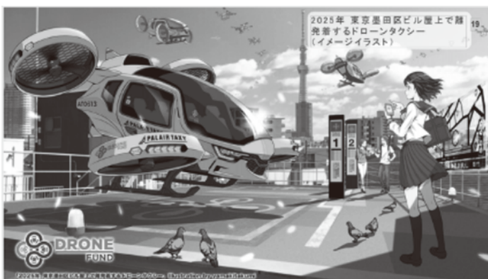
ドローンタクシー(イメージイラスト)

これらのことから中津川市がチャンスとなる可能性及び、中津川の立地条件からも直線距離で観光地と結ぶことを考えればメリットは多いと話された。