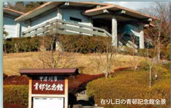
在り日の青邨記念館全景

2009（平成21）年11月24日、一部の作品の盗難事件が発生し休館となり、2015（平成27）年6月に閉館となった。同館にあった作品は、近くの中津川市苗木遠山史料館で随時行われる特集展示などで観ることが出来るが、早期の再建が待ち望まれるところである。