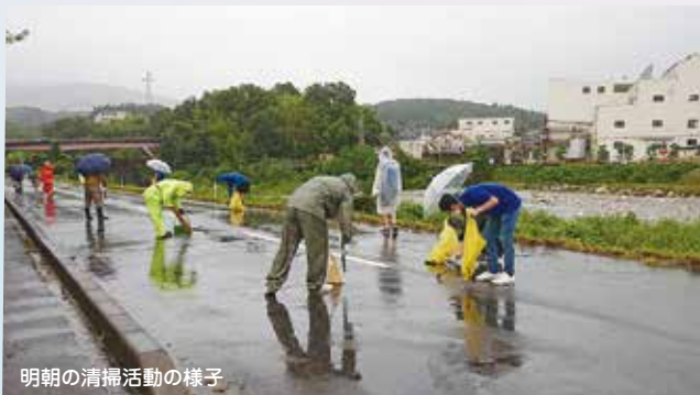
明朝の清掃活動の様子

花火大会当日は、万一の混雑に備えて、会場周辺を訪れた人に3密回避、マスク着用を呼び掛けました。テーマに「誰もが輝く持続可能な中津川」を掲げて3号玉、4号玉、スターメイン計345発を打ち上げ。午後7時30分より30分間、雨が