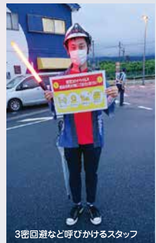
3密回避など呼びかけるスタッフ

自宅から花火が見られない市民の方々に楽しんでいただく為、ユーチューブでライブ配信し、多い時には、1,600人の方が視聴されました。13日の朝には、ボランティア・実行委員のメンバーにより、会場周辺の清掃を行いました。