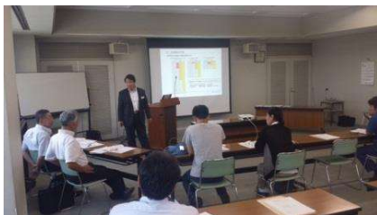
セミナー風景(イメージ)

東京海上日動火災保険(株)様に協賛頂き、台風シーズンに入る前に、「BCPセミナー」を 無料開催 致します!!