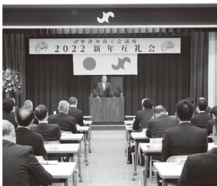
新年互礼会の様子

対策などの経営相談はこの2年間で3,656社から11,700件、融資は金額ベースで従来の5倍の相談を受けている。会員も目標の1,800会員を越えた。