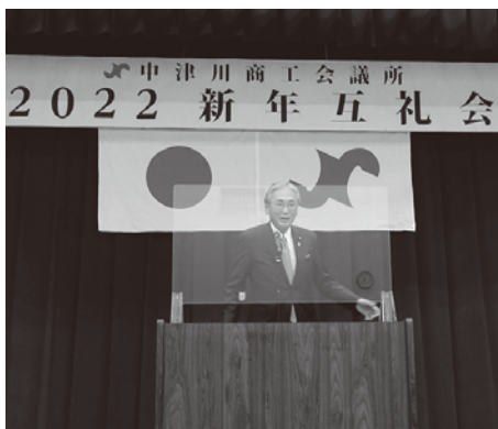
古屋圭司衆議院議員