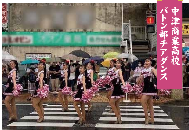
中津商業高校 バトン部チアダンス