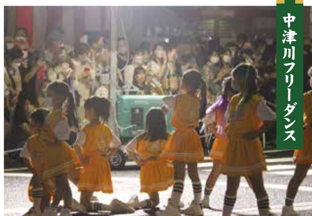
中津川フリーダンス