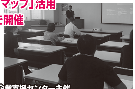
中津川市中小企業支援センター主催