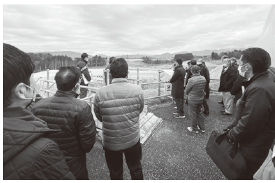
中部総合車両基地の視察

全体的には工事はまだ始まったばかりといった印象であるが、これからもこういった視察の機会を増やし、各関連機関との連携を取りながら情報共有していく事で安心・安全な工事を進めて行ける様、当所としても協力していきたい。