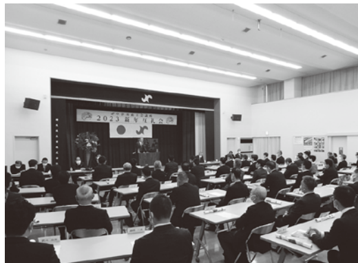
新年互礼会の様子

市街地の活性化についても、市民 交流プラザ(仮称)の建設工事は進ん でいるが、現状ではその次の活性化 戦略が見えてこない。観光・移住定住 に繋がる、他地域と差別化できる魅 力あるまちづくりが必要。