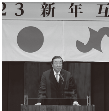
平岩正光岐阜県議会議長