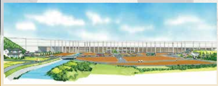
リニア岐阜県駅周辺(整備イメージ)