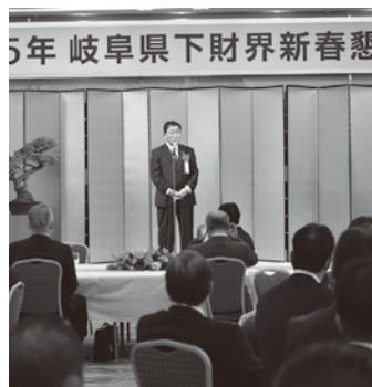
古田知事来賓祝辞

1月16日(月)、商工会議所連合会、 経営者協会、経済同友会の経済3団体 が主催する2023年県下財界新春 懇親会を岐阜グランドホテルで開催。