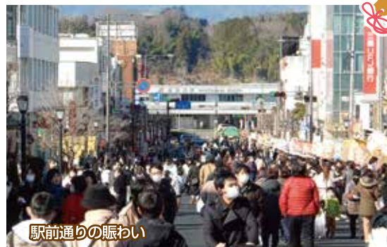
駅前通りの賑わい