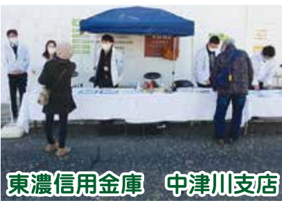
東濃信用金庫 中津川支店