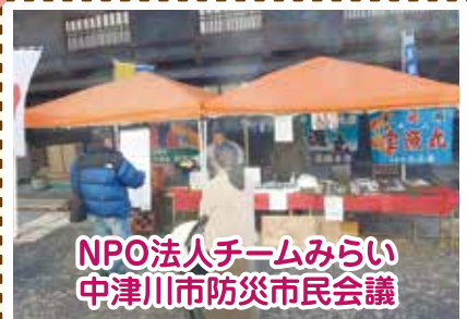
NPO法人チームみらい 中津川市防災市民会議