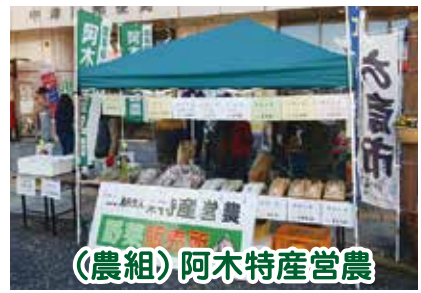
(農組)阿木特産営農