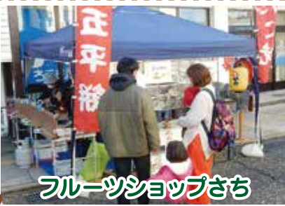
フルーツショップさち