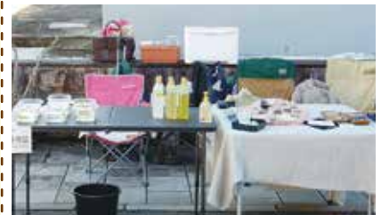
なるなるのめだか