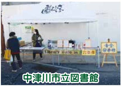
中津川市立図書館