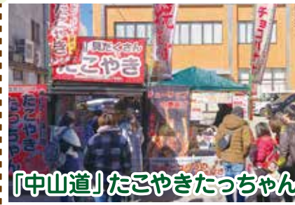
「中山道」たこやきたっちゃん