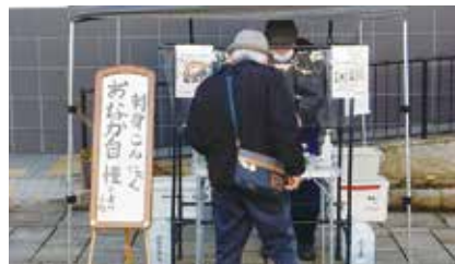
こんにゃく工房 おなか自慢