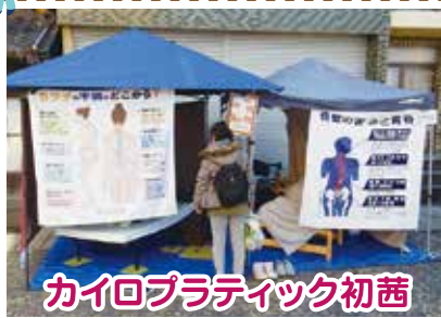
カイロプラティック初茜