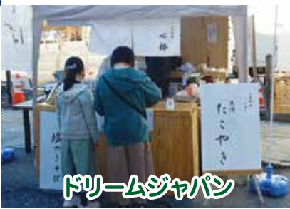
ドリームジャパン