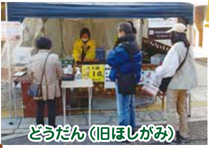
どうだん(旧ほしがみ)