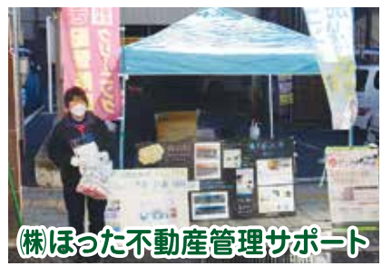
株ほった不動産管理サポート