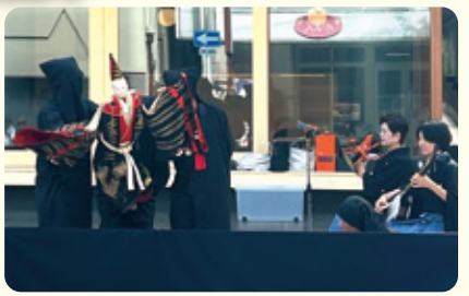
300年の歴史を誇る恵那文楽!