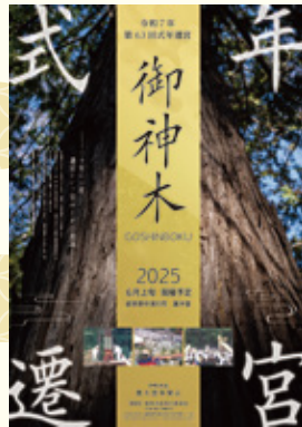
〈作成中のポスター〉

今後はこの中津川市としての一大行事を盛り上げていくため、御神木祭実行委員会を立ち上げて各種事業を行っていきます。本事業を市民の方をはじめ市内外へ広く周知するためのポスター作製や、中心市街地での催しの実施などに取り組んでいきますので、皆様のご理解、ご協力、ご支援を賜りますようお願いいたします。