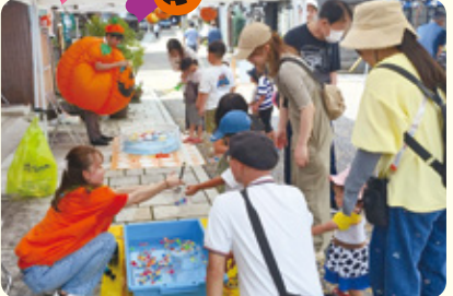
スーパーボールすくい