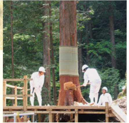
〈前回(2005年)の御神木伐採の様子〉

式年遷宮では岐阜県中津川市加子母の裏木曾国有林で育まれた木が、御神木として使用されます。これは日本でも長野県上松町と当地の2か所のみとなります。この御神木は『御樋代木』と呼ばれ、令和7年6月上旬に御神木の切り出しを行い、岐阜・愛知・三重とまたく伊勢神宮までの300キロの道を奉搬されていきます。