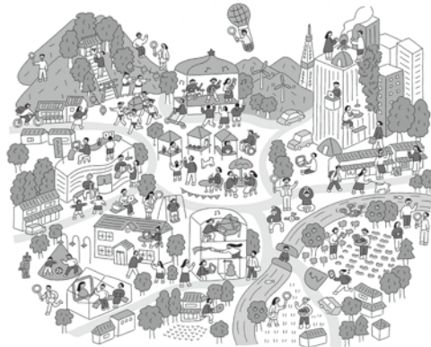
あなたと、まちと、みらいをつなぐ。