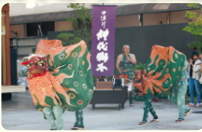
迫力満点の神代獅子!