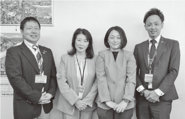
アクサ生命保険推進員

当所職員とアクサ生命保険㈱の担当社員がお伺いした際には、是非ご協力いただきますようお願い申し上げます。