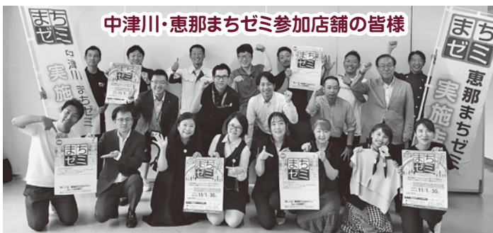
中津川・恵那まちゼミ参加店舗の皆様

第4回目となる『得する街のゼミナール=まちゼミ』を開催いたします。今回は全44講座、32店舗の参加となり、中津川市・恵那市の合同開催です。