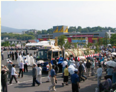
〈前回のにぎわい広場での行事の様子〉