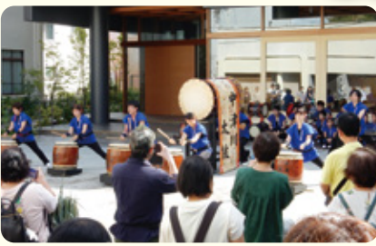
会場に響き渡る中津川太鼓!