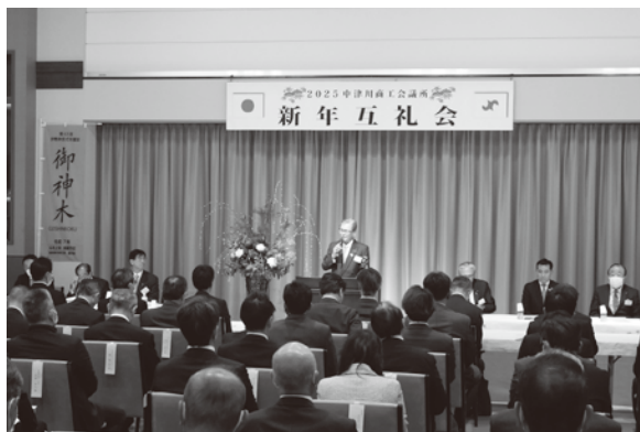
新年互礼会の様子

昨年の世界経済を振り返れば、各地で戦争や紛争による危機感を感じた一年であった。国内では緩やかな景気回復と言われているが、生活の