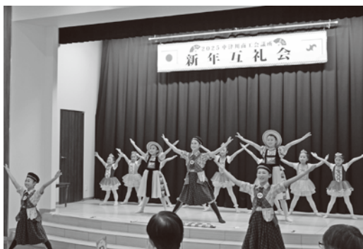
舞踊ゆきこま会様によるオープニングアトラクション

会員各位・関係諸団体・関係諸官庁等、皆様からのご支援とご理解をいただきながら新たな2025年が始まりました。本年もよろしくお願ひ致します。