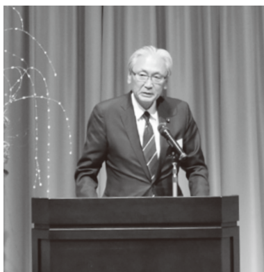
古屋圭司衆議院議員

続いて、出席来賓を代表して古屋圭司衆議院議員、小栗仁志中津川市長、平岩正光岐阜県議会議員、森益基岐阜県議会議員からのご挨拶をいた