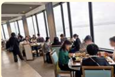
大津プリンスホテルでのランチビュッフェ