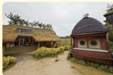
ラコリーナ近江八幡